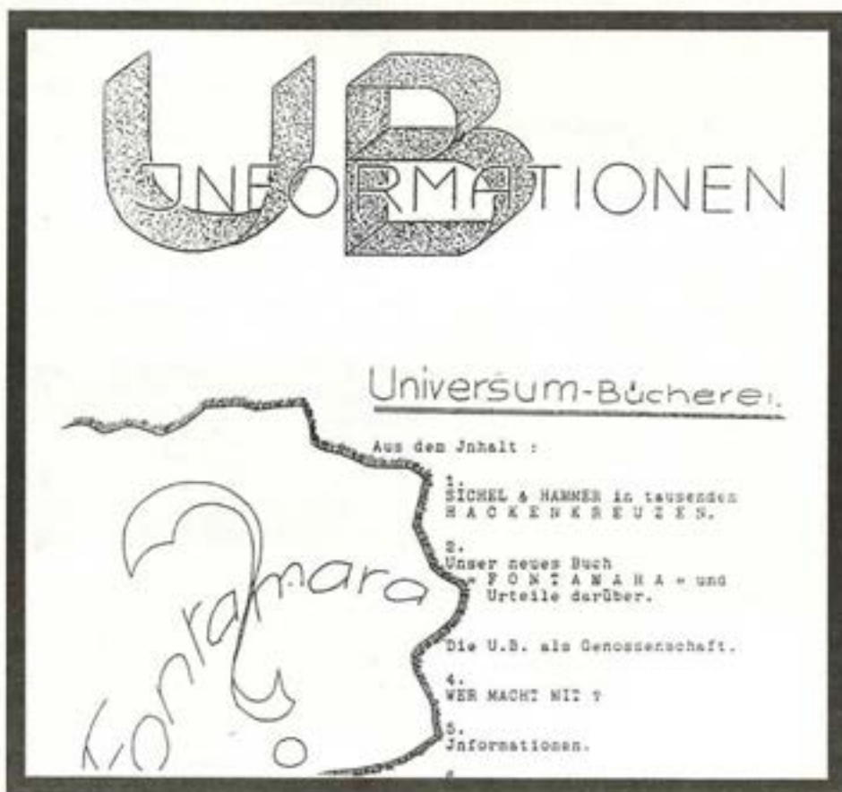
U.B. Informationen, Nr.2, Juni-Juli 1933

Während der gesamten Zeit (Juli-August 1933) kam es zu reichlich Konfusionen im gesamten Vertrieb der AIZ und der U.-B. Die Kolporteurs erhielten widersprüchliche Anweisungen. Die Leser waren ohne Zeitung und Bücher. Selbst in der Buchbinderei, wo man neue Titelblätter für die U.-B.-Ausgaben vorbereitete, entstand Verwirrung.