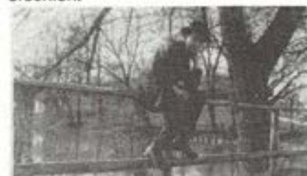
Vauchi am Allschwyl Weier 1917

In dieser nämlich, der rechten, waren von der ausbuchtung der stirne, die zwischen haargrenze und wölbung der augenbrauen schmaler, gedrückter gediehen war, bis zur weichen und schmiegsameren rundung der kinnhälfte, alle züge zarter und wie hinter ihren paargesossen der linken seite zurückgeblieben. diese inferiorität, rechts, wurde noch betont durch eine ausbiegung der nase zu ihr hin, so dass die gesamte gesichtsfläche in zwei ungleiche schnitte geteilt wurde, derartig wiederum, dass die linke an ausmass, zwischen nasenrücken und ohransatz gerechnet, gewann, die rechte aber kleiner und zwischen diesen zwei punkten beengt erschien.