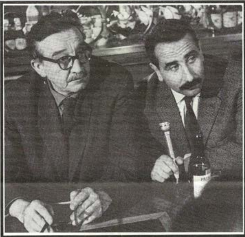
Vauchi bei der Vorbereitung zu der TV-Sendung « Heute Abend in » ca. 1962

tags darauf, als ich ihm begegnete, war zum ersten mal in mir, in meiner haltung zu ihm, ein umschwung eingetreten: die benommenheit, die beim sprössling auf einer begrenzung seines vorstellungsfeldes beruht, insofern er nämlich seinen erzeugern gewöhnlich eine gewisse integrität, eine höhere und keuschere lebensführung, hauptsächlich in allem, was ihr liebesleben betrifft, zuspricht und es nicht wahrhaben will, dass der vater denselben regungen und erregungen unterworfen ist, wie er und andere, ja die vermutung, dass es noch so sein könnte oder den blossen gedanken daran, mit abscheu und entrüstung von sich weist, war nach dem erlebnis mit dem zyklopenauge gewichen. in der art, so dazuliegen und zu schlafen hatte für mich eine gewisse schamlosigkeit, die preisgabe eben jener integrität, gelegen.