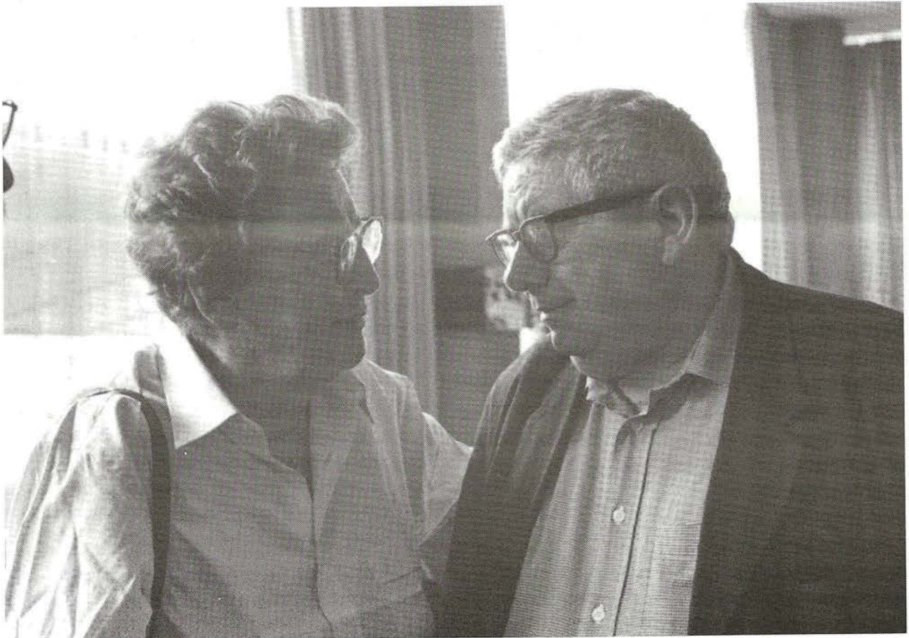
Hugo Loetscher und Laure Wyss auf der MV des Schweiz. Schriftstellerverbandes, Zürich 1996

Hugo Loetscher liest aus seinen Werken und kommentiert sie